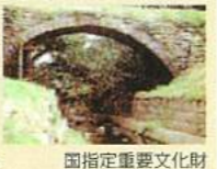
国指定重要文化財

延宝2年(1674)に早鐘池の用水を通すために大牟田川に架けた石造アーチ型水路橋で、この様式では日本最古。