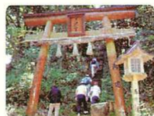
※三池宮と八大龍王宮の間に長田権現宮(中宮)があります。

霊泉・三つの池の出現により、千早に霊験あるということで三池宮を五穀豊穡の神、大権現として崇拜されるようになったと考えられています。