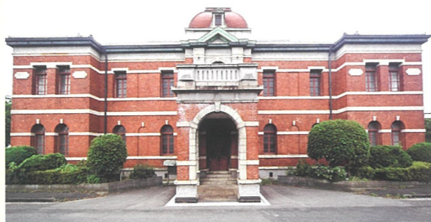
官営八幡製鐵所 旧本事務所