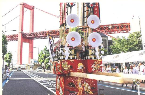
戸畑祇園大山笠行事