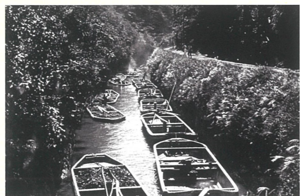
車返しのひらた船