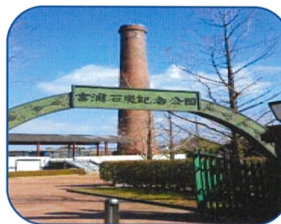
宮浦石炭記念公園