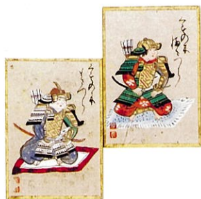
▲武者合わせ (かるた)