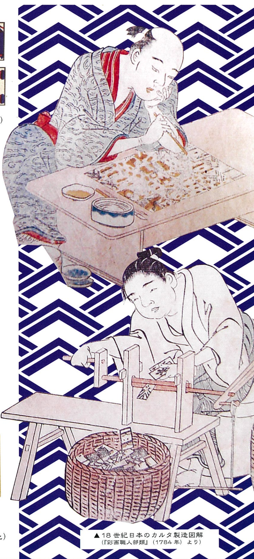
▲18世紀日本のカルタ製造図解 (『彩画職人部類』(1784年)より)