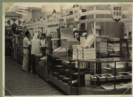
「松屋にて」