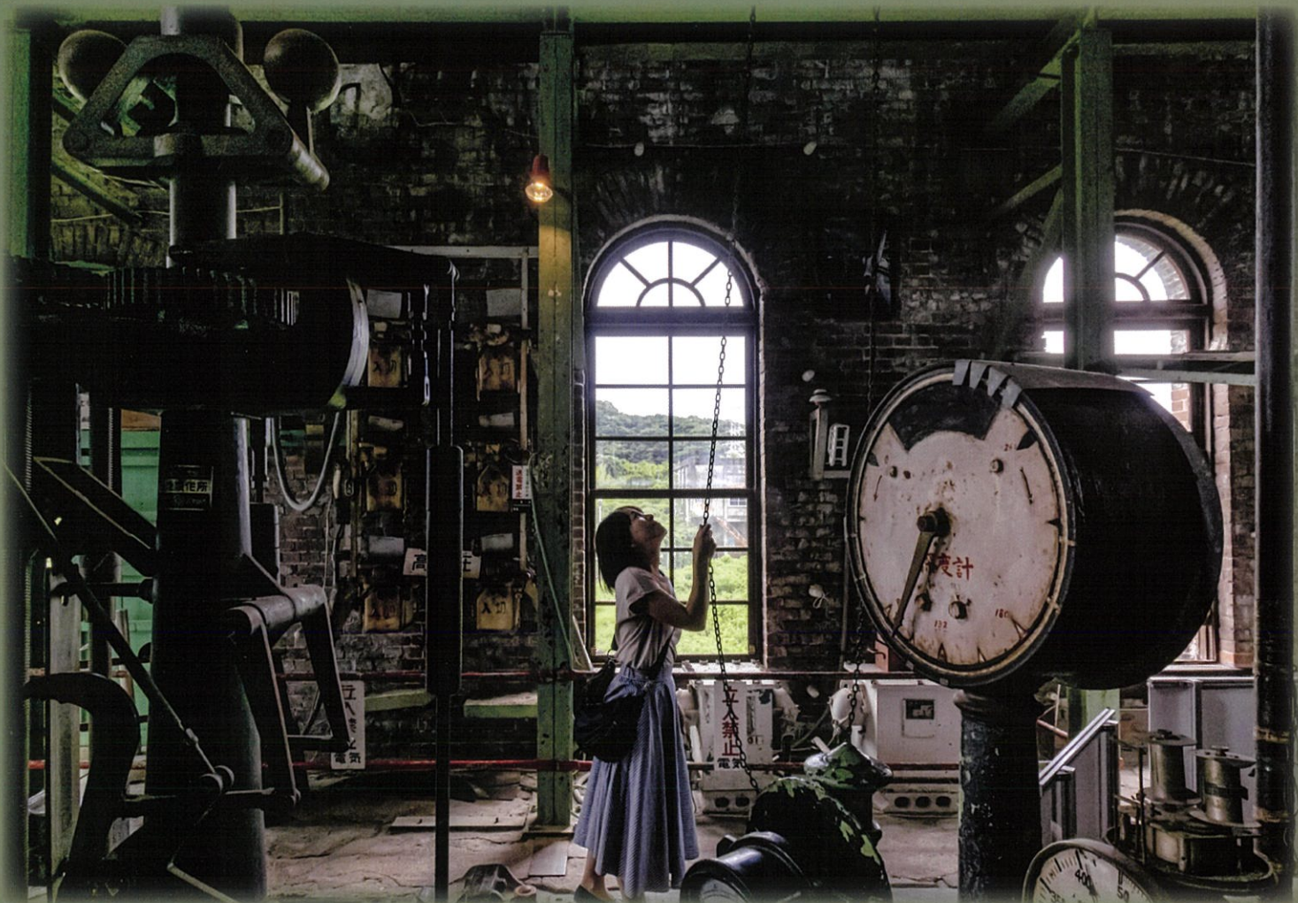
令和3年度 準グランプリ作品「遺跡の寸景」