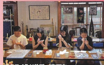
ろうそく作り体験／島原市

豊富な湧水量を誇る池には色とりどりの鯉が泳ぎ、庭内には緑が溢れるもの全てを魅了する邸宅です。