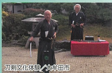
刀剣文化体験／大牟田市

現存する日本最古の鋼鉄製竪坑櫓が見学できます。歴史的価値をガイドがお伝えします。