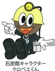
石炭館キャラクター クロベエくん