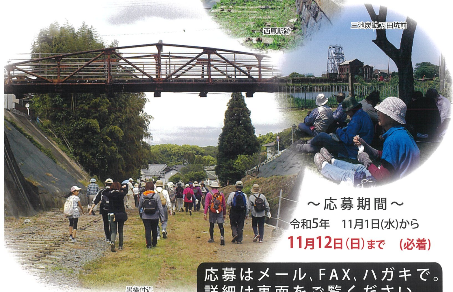
三池炭鉱万田坑前