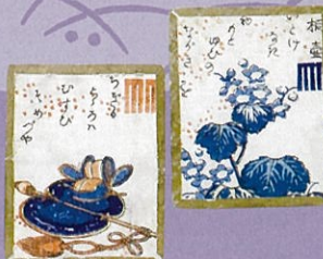
▲風流源氏歌カルタ

今回の企画展では、当館が所蔵する江戸時代に制作された源氏物語や伊勢物語、古今和歌集などの多彩で多様な歌カルタを一堂に展示し、その歴史の変遷や特徴をたどるとともに、優美で奥深い歌カルタの世界を紹介します。