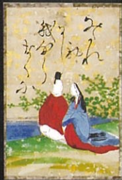
▲絹地伊勢物語カルタ