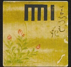
▲方形絹地源氏紋カルタ