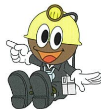
石炭館キャラクター クロベエくん

石炭産業科学館では、写真以外でも、炭鉱や地域の産業や歴史に関する資料を随時収集しています。