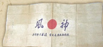
神風手拭(女子挺身隊用)