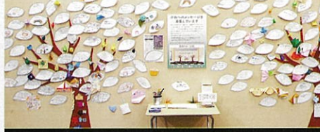
2022年展示「みんなで作る平和の木」

葉っぱの形をしたメッセージカードに、平和への祈りのメッセージや、イラストを描いて、枯れ木を青々とした大樹に育ててみませんか？