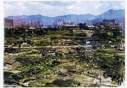
大牟田空襲後の写真 (AIでカラー化したもの)

今回は大牟田空襲を調査・研究して いる「大牟田の空襲を記録する会」の 資料と当館の戦争資料を紹介します。