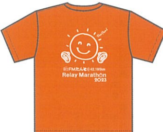
(昨年のTシャツイメージ:背面)