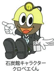
石炭館キャラクター クロベエくん