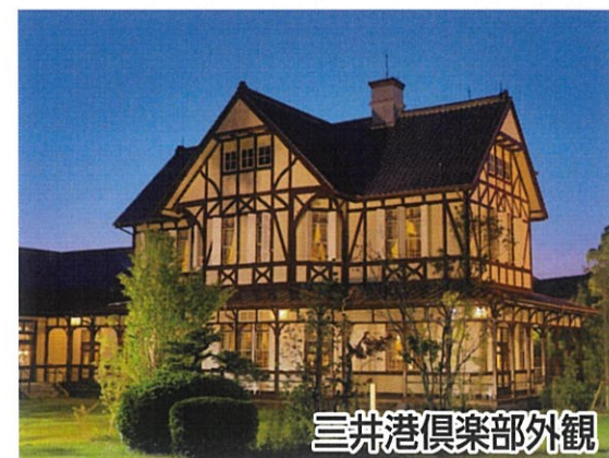
三井港倶楽部外観