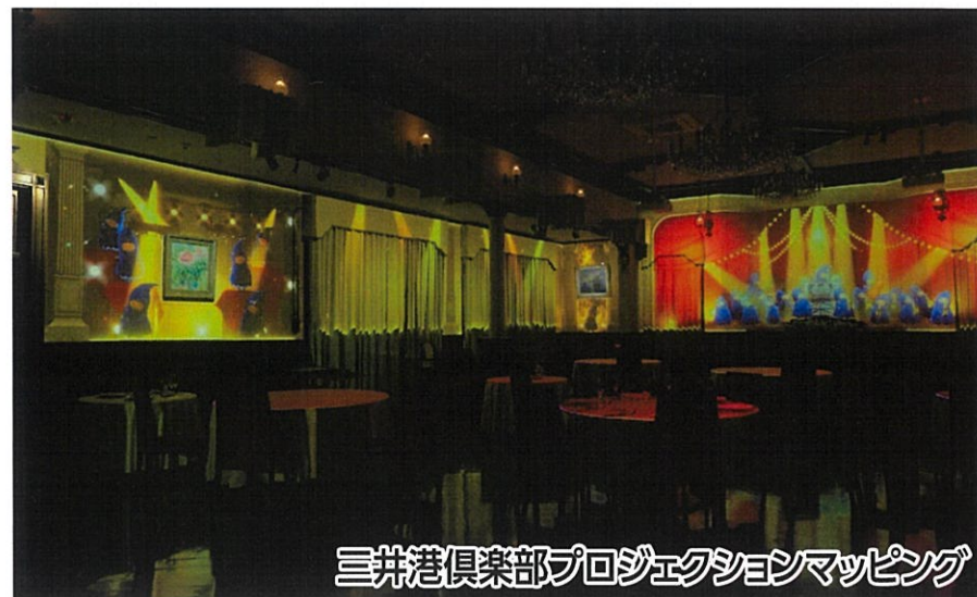
三井港倶楽部プロジェクションマッピング

三井港倶楽部では、5月から始まったプロジェクションマッピングを参加者に公開します。三井港倶楽部の敷地から入場できる三川坑跡や国登録有形文化財の大牟田市庁舎では公開イベントも開催!大牟田の見どころが沢山のコースです。三井港倶楽部では先着100名様にお得な特典アリ!