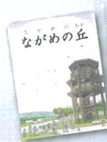
▲五條かるた(五條市)