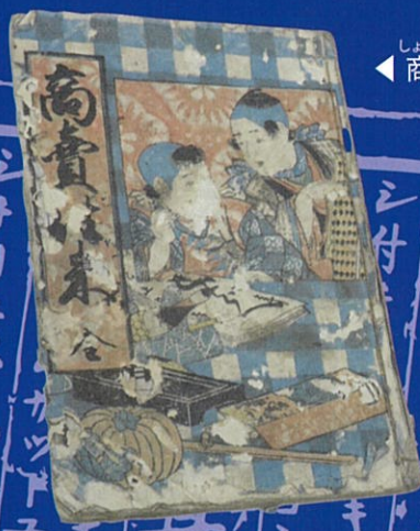
しょうばい おうらい ◀ 商売往来