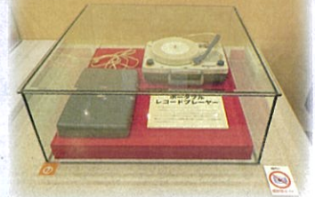
▲ポータブルレコードプレーヤー