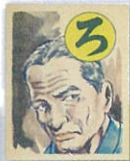
▲少年探偵団かるた(昭和31年)