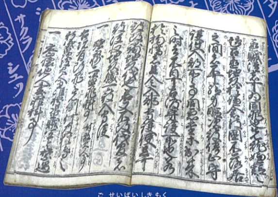
こせいばいしきもく ▲御成敗式目